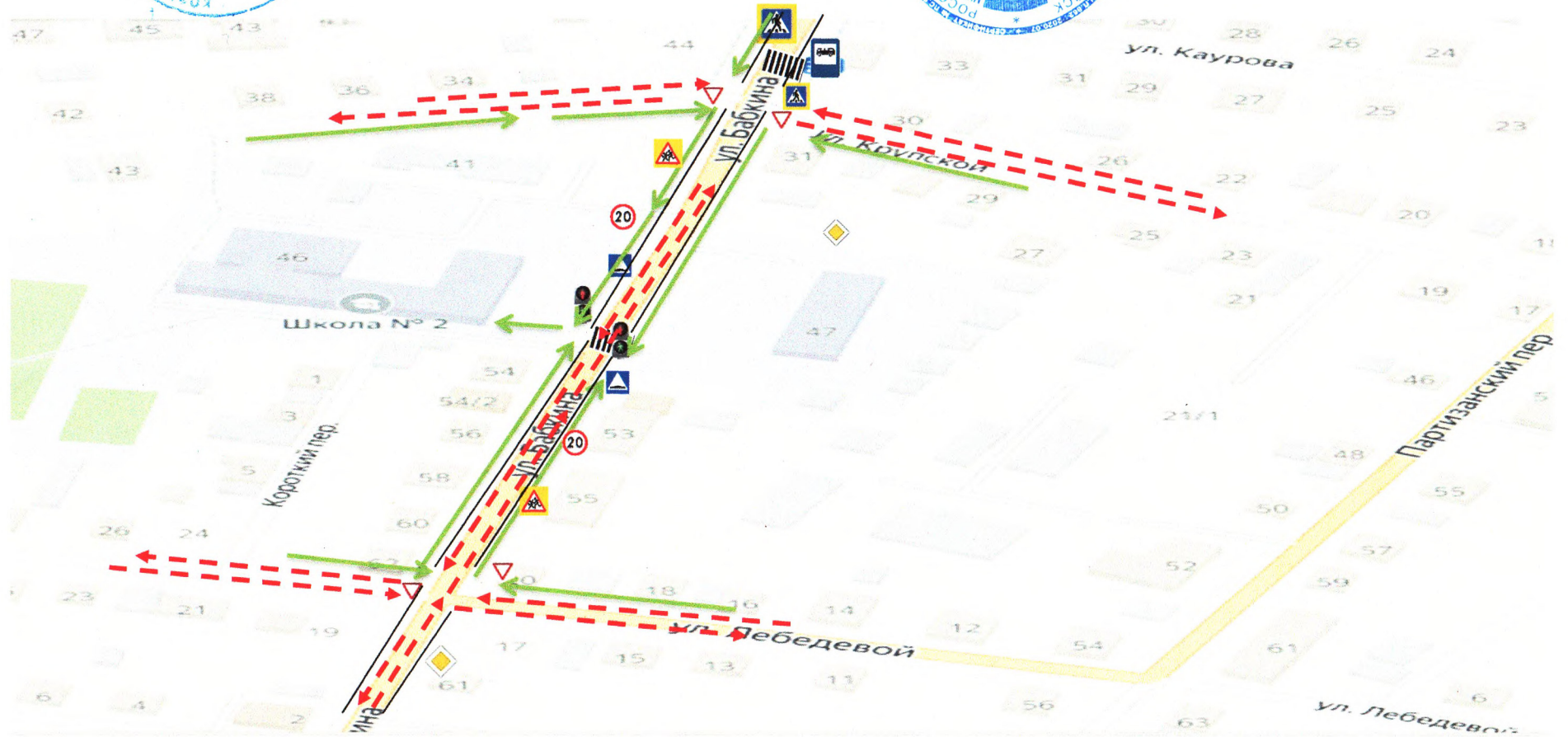
Схема безопасного маршрута учащихся МБОУ «Средняя школа №2 им П.Д.Щетинина» «Дом-Школа-Дом»